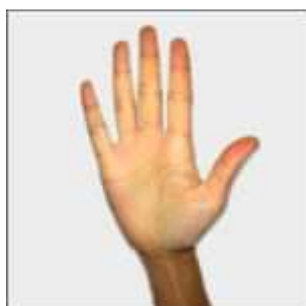
五 wǔ : cinq