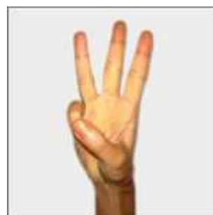
三 sān : trois