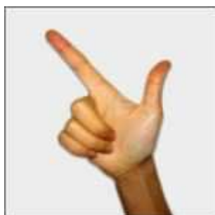
八 bā : huit