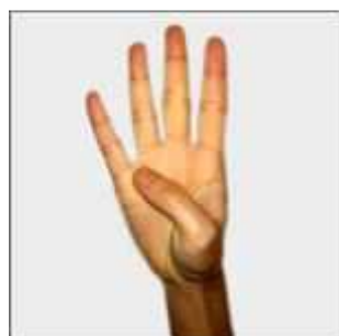
四 sì : quatre