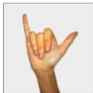
六 liù : six