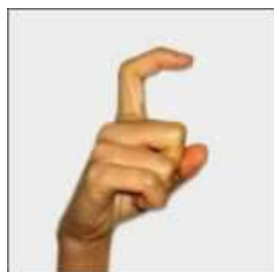
七 qī : sept