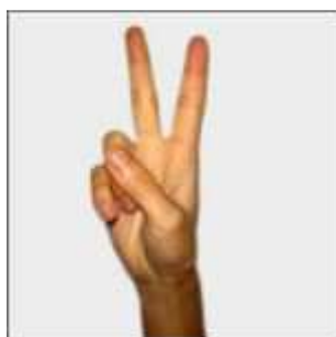
二 èr : deux